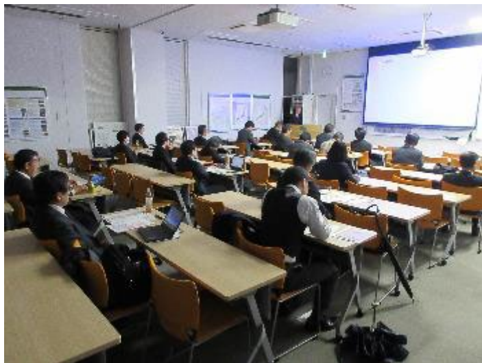
2020年1月27日 中小企業への普及について 勉強会