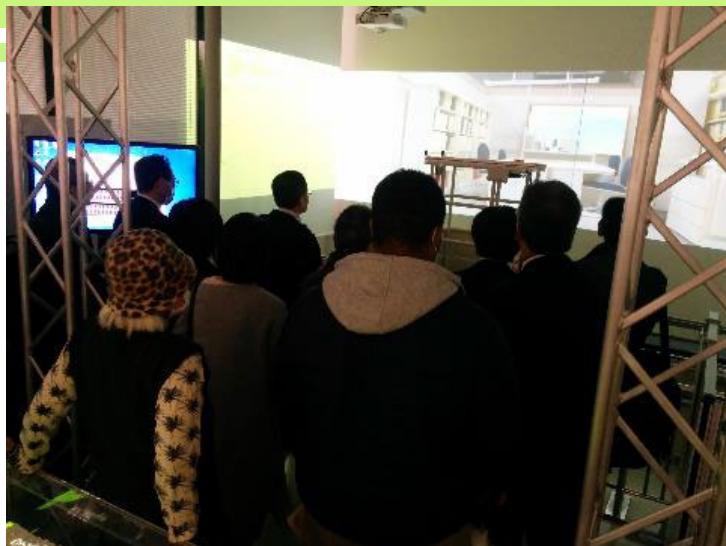
実際に観測された地震波を実感 2019年12月10日 免震層・ダンパーの実物を見学