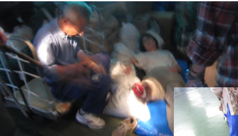
(スタートトリアージ)