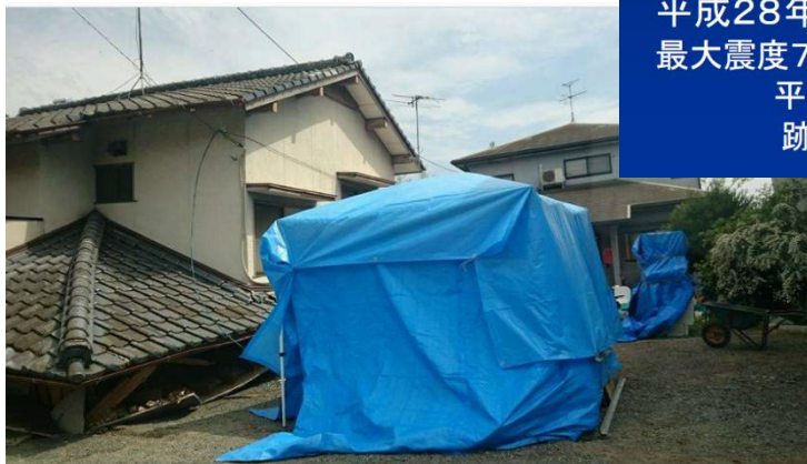
1階が潰れた家の隣にブルーシートの テントを張って暮らす(益城町 中心市街地) H28.4.20