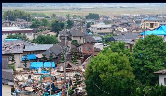
平成28年4月14日、16日 熊本地震 最大震度7(熊本県益城町) 平成28年5月25日 BCAO総会 跡見学園女子大学 鍵屋 一